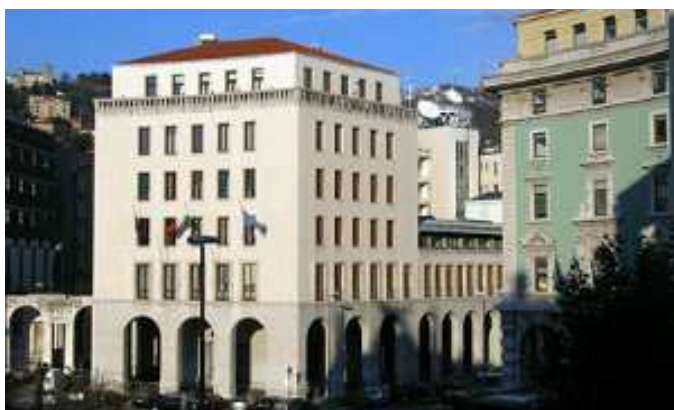
Palazzo del Consiglio regionale sito in Piazza Oberdan 6, Trieste

Secondo quanto stabilito dall'articolo 121 della Costituzione e dall'articolo 24 dello Statuto speciale della Regione autonoma Friuli Venezia Giulia (legge costituzionale n. 1/1963), il Consiglio regionale , quale massimo organo rappresentativo della comunità regionale, esercita le potestà legislative attribuite alla Regione e le altre funzioni conferitegli dalla Costituzione, dallo Statuto speciale e dalle leggi dello Stato.