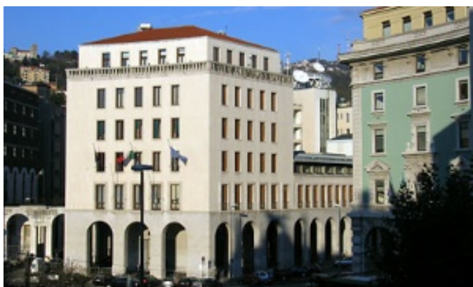
Palazzo del Consiglio regionale sito in Piazza Oberdan 6, Trieste

Secondo quanto stabilito dall'articolo 121 della Costituzione e dall'articolo 24 dello Statuto speciale della Regione autonoma Friuli Venezia Giulia (legge costituzionale n. 1/1963), il Consiglio regionale , quale massimo organo rappresentativo della comunità regionale, esercita le potestà legislative attribuite alla Regione e le altre funzioni conferitegli dalla Costituzione, dallo Statuto speciale e dalle leggi dello Stato.