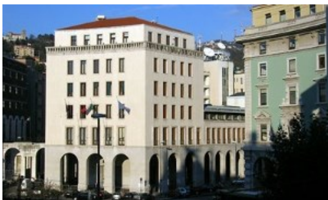
Palazzo del Consiglio regionale sito in Piazza Oberdan 6, Trieste

Secondo quanto stabilito dall'articolo 121 della Costituzione e dall'articolo 24 dello Statuto speciale della Regione autonoma Friuli Venezia Giulia (legge costituzionale n. 1/1963), il Consiglio regionale , quale massimo organo rappresentativo della comunità regionale, esercita le potestà legislative attribuite alla Regione e le altre funzioni conferitegli dalla Costituzione, dallo Statuto speciale e dalle leggi dello Stato.